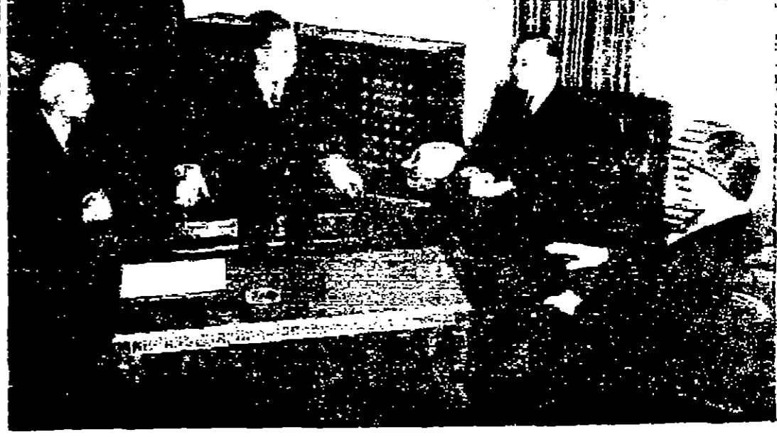
دولة السيد بهجت الطهوني رئيس الوزراء تحت الى الدكتور غونزاليز بحضور السيد احمد طوقان نائب رئيس الوزراء وعبد القم الزماني وزير الخارجية في تصوير سحر اميس

الخاروف الصغرى جبل الحسين - دوان غراسي تلقون ٣٠٥١٦